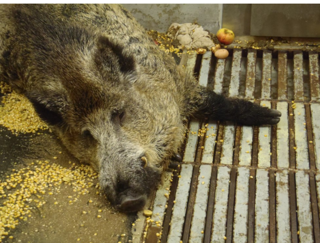
Abb. 4: Keiler mit unspezifischen Symptomen