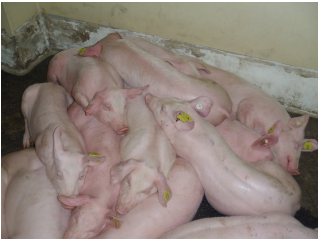
Abb. 3: Hausschweine mit hohem Fieber

Die Erkrankung ist auf der Basis klinischer Symptome nicht von der klassischen Schweinepest (KSP) und anderen schweren Krankheitsverläufen zu unterscheiden!