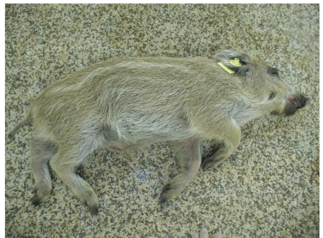
Abb. 5: Perakut verstorbener Frischling

Für den Antikörpernachweis in Serum und Plasma stehen mehrere, bisher in Deutschland nicht zugelassene ELISA-Kits zur Verfügung. Darüber hinaus können Antikörper mittels indirekter Immunfluoreszenz- oder Immunperoxidasetests nachgewiesen werden. Immunoblots werden ebenfalls eingesetzt. Probenmaterial der Wahl ist Serum.